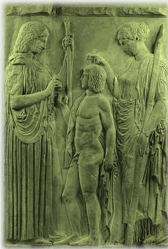
(Great Eleusis Frieze, Eleusis Museum, Greece, late 5 th c. BCE)

seminární práce pro předmět FSS MU PSY208 Interpretace a imaginace